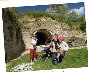
Fort de Condé