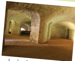
La double caponnière