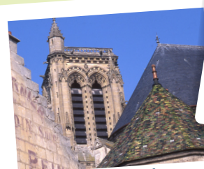
La cathédrale de Soissons