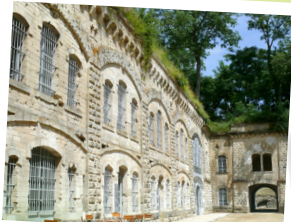
Fort de Condé

Planté dans les années 2000 par les enfants des écoles voisines, l'arboretum compte une quarantaine d'essences d'arbres. Citons notamment une collection d'arbres d'Amérique (le tulipier de Virginie ou encore l'érable Negundo) ou encore des espèces très anciennes comme le Ginko Biloba (ou abricotier d'argent) originaire d'extrême orient.