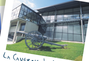
La Caverne du Dragon

Pour plus d'informations : Office de Tourisme du Val de l'Aisne - Fort de Condé 02880 CHIVRES-VAL ☎ +33 3 23 54 40 00 GPS : N 49.401288 - E 3.454155