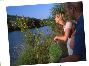
Les rives de l'Aisne

Cette forteresse souterraine, située sur la ligne de front opposant les combattants de la Première Guerre Mondiale, est devenue le symbole de la Grande Guerre en accueillant le musée du Chemin des Dames. ☎ +33 3 23 25 14 18 – GPS : N 49.44188 - E 3.732648